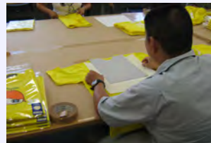
取材当日は24時間テレビ関連商品の検品と包装を行っていました。

東有岡ワークハウスとは?……障害者自立支援法に基づく、主に精神障がい者の方々を対象とした通所施設です。今すぐ就労することが難しい方や、社会参加の機会を増やしたい方が作業やレクリエーションなどを通して生活のリズムをつけたり、様々な訓練活動等を行うことによって、その人に合った就労や地域生活などの日中活動を支援します。現在、就労移行支援に21名、就労継続支援B型に27名、生活訓練事業に3名、計51名の利用者登録(ともにH24年6月末時点)があり、1日平均30名弱の方々が通所されています。事業内容は、企業から受託した作業を行う生産活動を中心に、訓練活動、実習、求職活動・職場定着支援、その他必要な支援を、精神保健福祉士をはじめとする施設スタッフが行います。