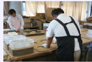
段ボールの糊づけと組み立て。毎日400個を組み立てて納品しています。