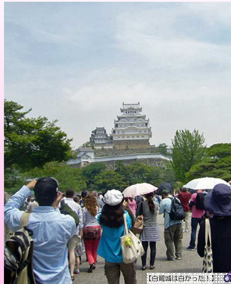
【白鷺城は白かった!】

当法人が運営する、精神障がいをお持ちの方を主な対象とした就労継続支援B型事業所「伊丹東有岡ワークハウス」と「サポートテラス昆陽東」が合同で5月22日に園外研修を実施しました。利用者さん達が話し合っ決めて今年の行先は「姫路城と姫路セントラルパーク」。改修工事を終えてきれいになった姫路城を前にシャッターを切る参加者の皆様です。