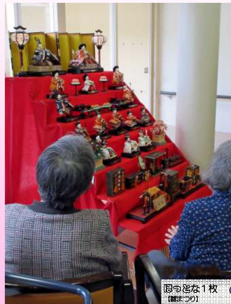
介護老人保健施設ケアハイツいたみに飾られた7段の雛人形の前で、せっかくなので女性の利用者様にお集まり頂き、即席の雛まつりを行いました。雅な人形達と一緒に写真撮影会をしました。