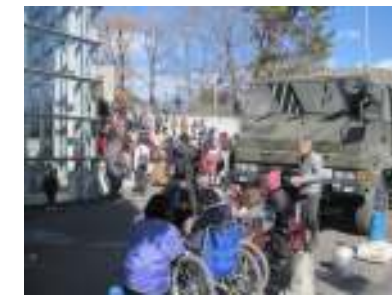
昆陽池公園での炊き出し訓練に参加