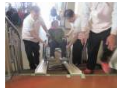
スロープを使い2階へ避難