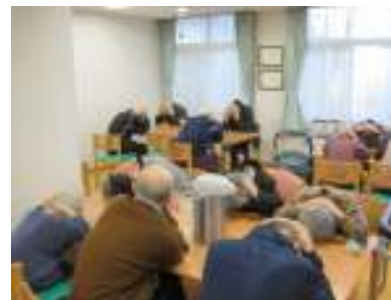
1分間のシェイクアウト

今後も震災の記憶を忘れず、普段から防災に取り組むことを職員一同心がけてまいります。