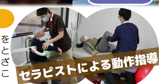
セラピストによる動作指導

南野ステップアップデイでは、セラピストがご本人やご家族のご希望を聞き取り、その方だけの個別プランを作成します。その目標は、「もっと歩けるようになりたい!」「家族と一緒に旅行に行きたい!」とさまざま。その目標に向けて、まずは立ち上がることから始め、次は車に乗ること、次は歩行...と段階的に、セラピストとともにゴールを設定します。