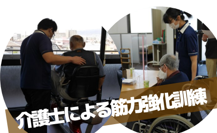
介護士による筋力強化訓練

テイルームには、筋力を鍛える豊富なマシーンを揃えています。もちろん、体だけでなく手先のトレーニングや脳トレのメニューもあります。体を動かした後はマッサージチェアによるリラクゼーションを受けていただいたり、お茶を飲みながら、ゆっくり休憩をとっていただけます。マシンは全部で8種類。全職員が目標に沿って、筋力アップや基礎体力のアップをサポート。大きな窓から町を眺められる開放的なロケーションでトレーニングができます!