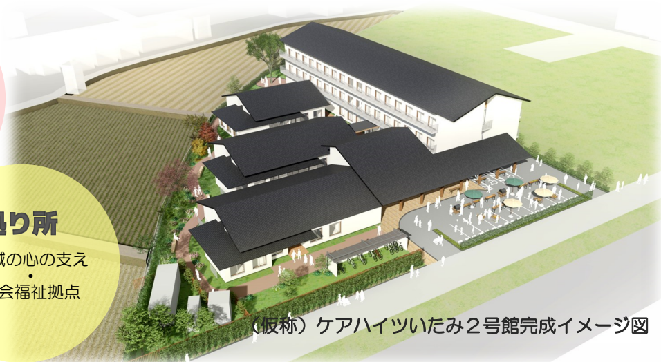
(仮称) ケアハイツいたみ2号館完成イメージ図