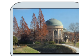
高い専門性で在宅生活をサポート！