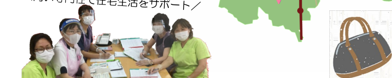
私たちが訪問します！