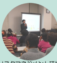
リスクマネジメント研修