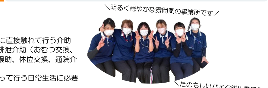
明るく穏やかな雰囲気の仕事所です！

訪問看護を中心に訪問リハビリ、療養通所看護を効果的に組み合わせ、医療依存度の高い高齢の方や障がいのある方、障がいのある子どもさん等さまざまな在宅医療者を対象に、多様で幅の広いサービス提供に取り組んでいます。