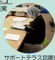
サポートテラス昆陽東

障害福祉サービス 平均工費 東有岡ワークハウス 17,000円/月 400円/時 サポートテラス昆陽東 10,000円/月 333円/時