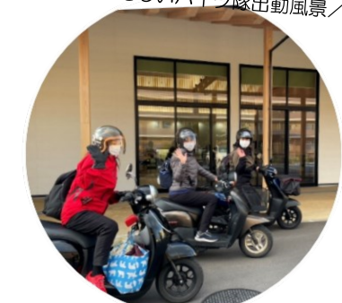
たのしいバイク隊出動風景！